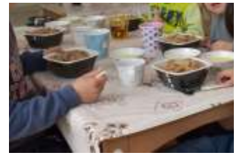
子どもたちにあたたかい 「牛丼弁当」を提供

今後は4月以降も施設へ食事をお届けし、取り組みの範囲を拡大したいと考えています。現在も、あらゆる生活環境や家庭環境によって施設などで食事をとる子どもたちや、長期化するコロナ禍で生活が変化して今まで通りの食事が難しい家庭も多く存在しています。本取り組みがこのような状況下の子どもたちや子どもたちを支援する方々の一助となればと思っています。