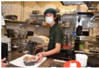
吉野家にて 「牛丼弁当」を作成