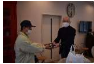
児童養護施設などにお届け