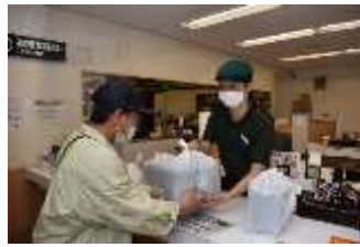
できたての「牛丼弁当」を 出前館の配達員にお渡し